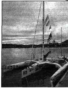
Le trimaran Région Aquitaine-Port Médoc.

rience personnelle n'attend qu'une consécration de plus : terminer le transat en bonne place.