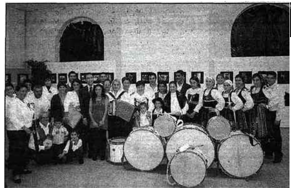
L'association portugaise d'Anglet a pris part aux festivités.

Une ambiance 100 % portugaise en clôture des journées du jumelage entre Hendaye et Viana Do Castelo, pour le décrochage de l'exposition des photographes vianais et hendayais relatifs aux Semeilhanças , aux similitudes entre les deux villes. Une dernière soirée colorée avec la participation des danseurs et musiciens de l'association portugaise d'Anglet (une idée de sortie à retenir pour l'après-midi du dimanche 15 novembre au local de l'association où aura lieu une fête populaire).