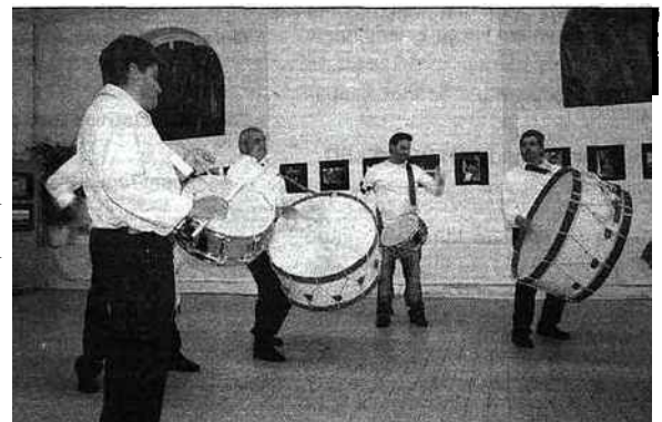
La clôture des journées du jumelage entre Hendaye et Viana Do Castelo s'est faite en musique.