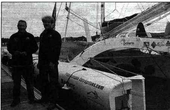
Les deux skippers du trimaran aquitain.